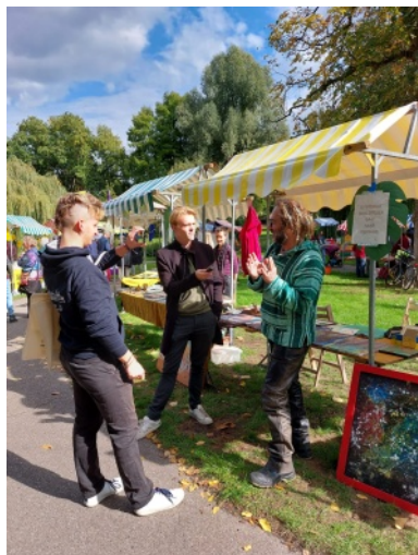
In gesprek tijdens Peace in the Park 2022

We hebben met een 10-tal groepen op 25 september een eerste festival georganiseerd onder deze naam. Het werd een succes waar we erg blij mee zijn. Er werd door 21 organisaties aan mee gedaan, er waren over de dag 250 bezoekers die in een goede sfeer elkaar leerden kennen en tot plannen